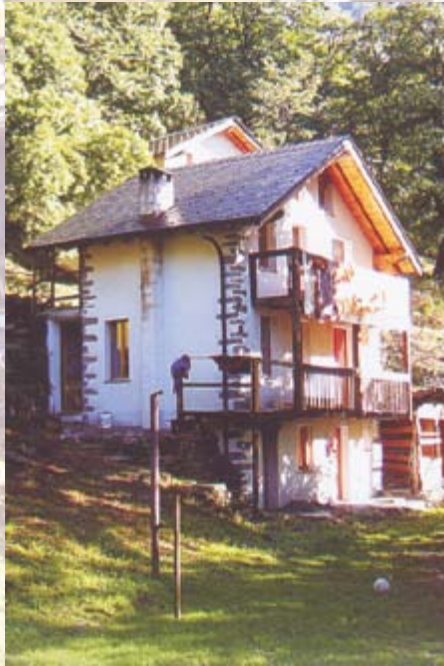
Bognago, in den nord-italienischen Bergen

So konnten wir schon für viele Jugendliche einen geeigneten Platz finden, als es im gewohnten Umfeld zu scheitern drohte. Die Jugendeinrichtung Pegasus in Südbaden setzt ihren Schwerpunkt auf Projektstellen mit kleinerem Setting und auf Erziehungsstellen. Im Zentrum stehen die Werkstatt für die Tagesstruktur und die Schule für die Eingliederung ins normale Schulleben. Immer wieder werden die Jugendlichen in verschiedene Naturprojekte eingebunden. Außerdem hat Pegasus eine eigene Anlage für Reittherapie. In diesem Setting sind die Jugendlichen meist schnell im Dorfleben integriert.