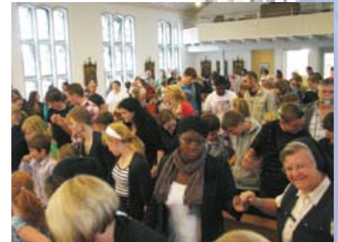
Alle Besucher fassen sich zum gemeinsamen „Vater unser“ an die Hände.

Die Dilborner Jugendhilfe feierte mit einem gemeinsamen Frühstück im Kultursaal des Schlosses den ersten Advent. Nach der gutbesuchten Messe in der Kapelle empfingen die Showtrompeter aus Odenkirchen die Kinder und Jugendlichen mit rhythmischen Klängen. Ein ganz besonderer Dank an die Musiker, die neben der Musik auch eine Menge an Geschenken mitbrachten, und das alles, ohne eine Gage zu kassieren. Aber auch Jugendliche der Einrichtung sorgten mit ihren Musikbeiträgen für eine vorweihnachtliche Stimmung. Als sich zum Schluss die Musiker unter die Besucher mischten, klatschten alle in die Hände. Ein stimmungsvoller Einstieg in die nun beginnende Adventszeit.