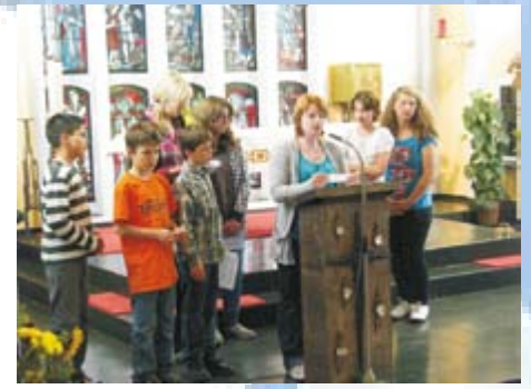
Fürbitten werden von den Kindern und Jugendlichen vorgetragen.