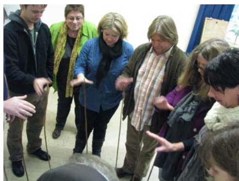
Wir packen es an

Die Orientierung am Prozess und eine »Fehlerfreundlichkeit«, die für uns Grundlage zur ständigen Verbesserung ist, sind weitere Eckpfeiler des Projektes.