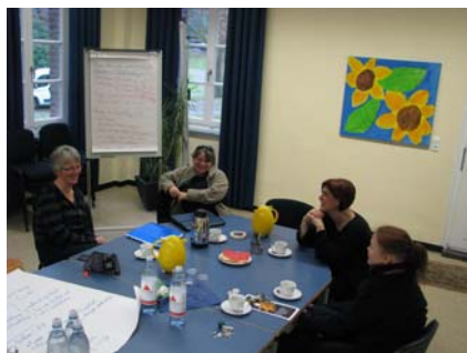
AG Auftraggeber und Umwelt